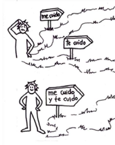
CNV cuidar-se i cuidar és possible

Els sentiments i les necessitats són universals; totes ens hem